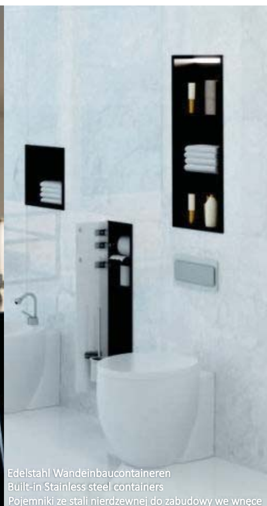
Edelstahl Wandeinbaucontaineren Built-in Stainless steel containers Pojemniki ze stali nierdzewnej do zabudowy we wnęce

UL.SUMIŃSKA 2a, SZCZERBICE 44-293 GASZOWICE POLAND TEL. +48 32 423 45 44 FAX +48 32 423 92 86 E-MAIL: MCJ@MCJ.PL