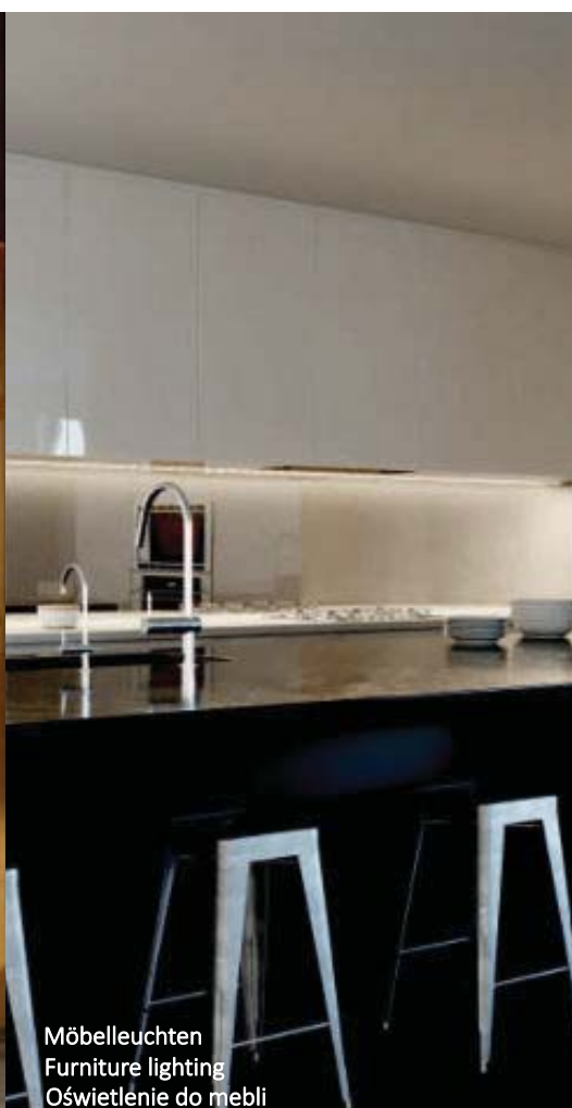
Möbelleuchten Furniture lighting Oświetlenie do mebli