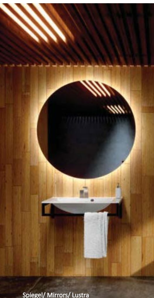
Spiegel/ Mirrors/ Lustra

IM ANGEBOT AUCH/ WE OFFER ALSO/ OFERUJEMY TAKŻE: